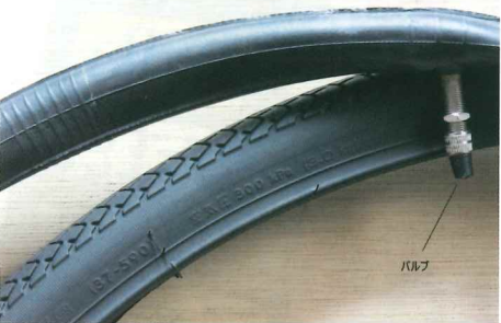
タイヤ、チューブ、バルブ

自転車は人力で駆動します。体力を有効利用するにはサドルを少し上げてみる。快適さに驚くはず。ほとんどの人は足が地面にベッタリ着くサドルの高さ。サドルに座ったまま足が地面に着かないと不安なのは理解できます。安全性が効率の問題です。スポーツタイプ自転車では停止の際、サドル前方に尻をはずして足を着きます。