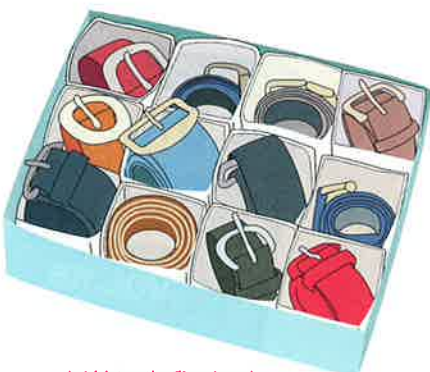
紙箱と牛乳パックで

もうすこしかっこよくしたいなら、VHSビデオテープのケースを利用します。ケースの厚さは約3cmですから、幅がそれ以下のベルト2本を大きめに巻いて入れます。ケースをいくつか積み重ねてもよいのですが、深めに引き出しなどに立てて収納するのがベスト（もちろんケース開き口側を上）。見た目がきれいなだけでなく、選んだり出し入れするのが簡単だからです。