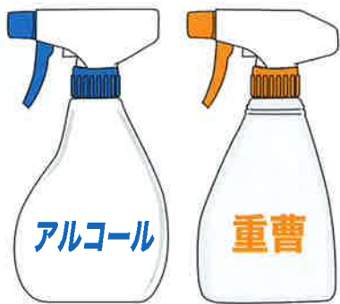
主役は重曹水とエタノールスプレー

庫内は重曹水をスプレーしたスポンジで磨きます。扉のゴムパッキンは汚れがこびりついて黒くなっています。使い古しの歯ブラシを使います。重曹水での掃除の後は水拭き、仕上げにエタノールスプレーを拭きつけた柔らかい布で拭き上げます。