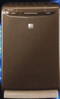
ACK75K-T ショコラブラウン