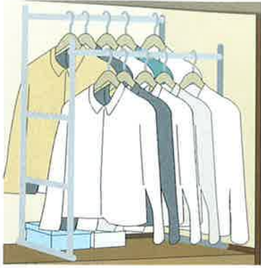
押入れ用ハンガーラック

下段に利用できる収納グッズも多彩です。押入れワゴン、押入れチェストなどはキャスター付きなので便利。伸縮式押入れ整理棚は、下段の収納物整理に