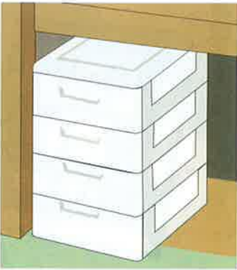
押入れ用チェスト